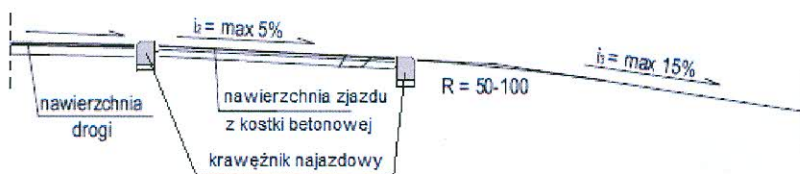
PRZEKRÓJ 1-1 (w nasypie)